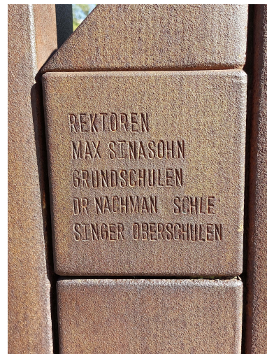
Abbildungen 6 und 7: Denkmal für die Israelitische Synagogen-Gemeinde Adass Jisroel in Form eines Menoraleuchters, Inschrift zur Erinnerung an Max Sinasohn, Siegmunds Hof 11, Berlin-Tiergarten, 2024