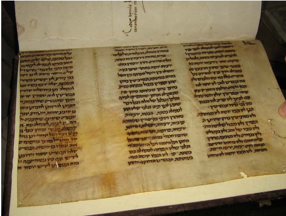
Eberhardsklausen bei Trier Sefer Teruma Fragment