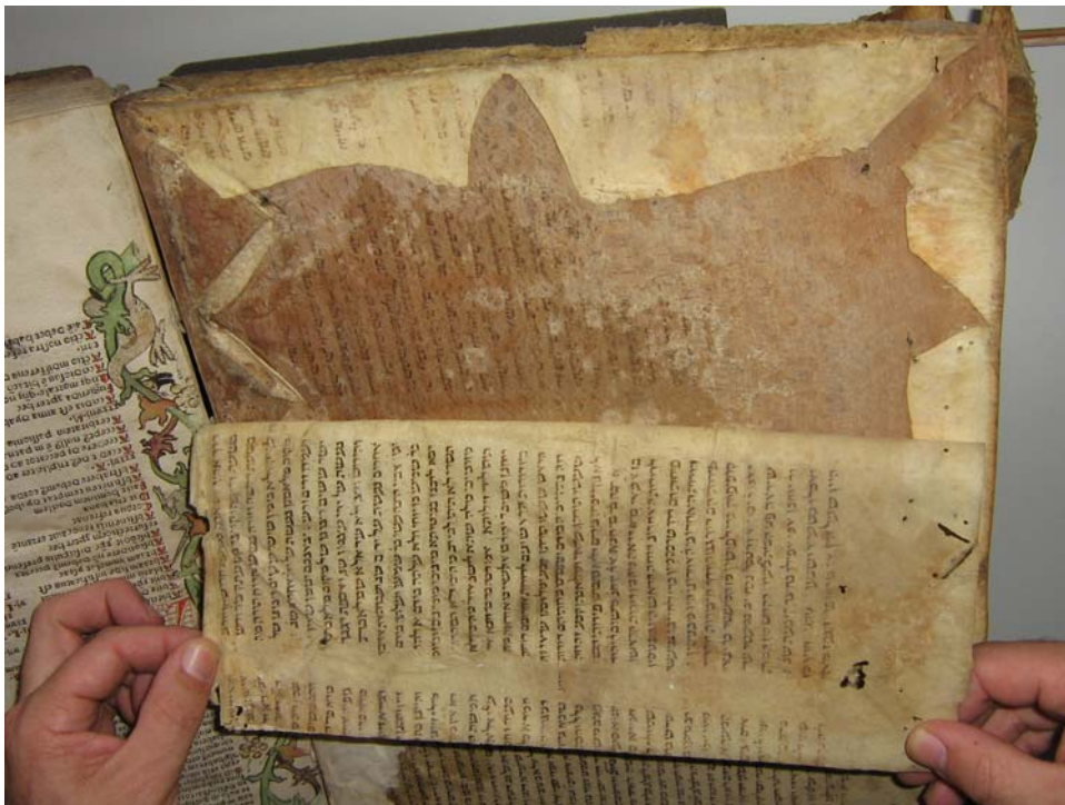
Gutenberg Museum Mainz Talmud Bavli